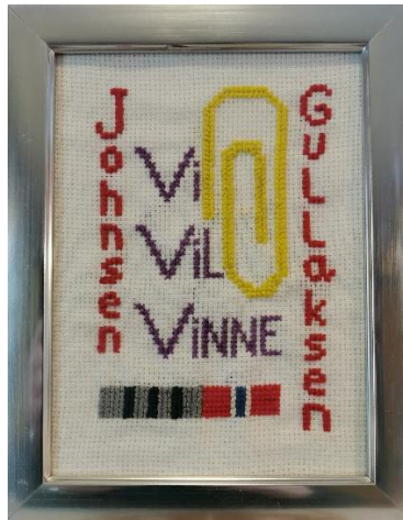
Geriljabroderi laget av forfatteren.