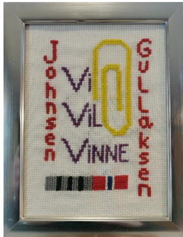
Geriljabroderi laget av forfatteren.